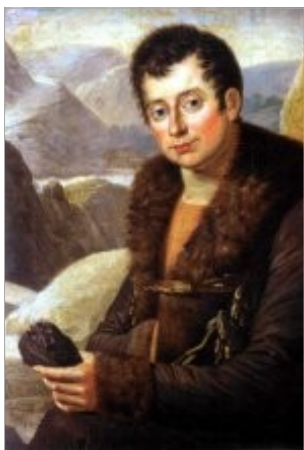
Портрет Николая Никитича Демидова. Художник Сальватор Тончи, 1797г. Пермская Художественная Галерея.

Никита Акинфиевич (1724—1789) был третьим сыном Акинфия Демидова и по смерти отца получил лишь незначительную часть наследства, но многократно умножил его, основав ряд новых заводов и предприятий, и стал обладателем огромного состояния. Он покровительствовал ученым, находился в переписке с Вольтером, был избран почетным членом Императорской Академии художеств, в 1771—1773 годы путешествовал за границей, посетил Рим, Париж, Лондон, изъездил Италию, пожертвовал значительные суммы на археологические раскопки и изучение сохранившихся памятников античной древности.